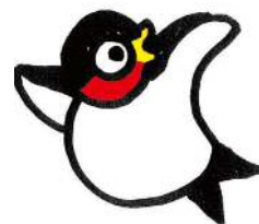
キラキラ鳥 (川越町)