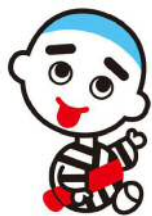
キャラクター こにゅうどうくん (四日市市)